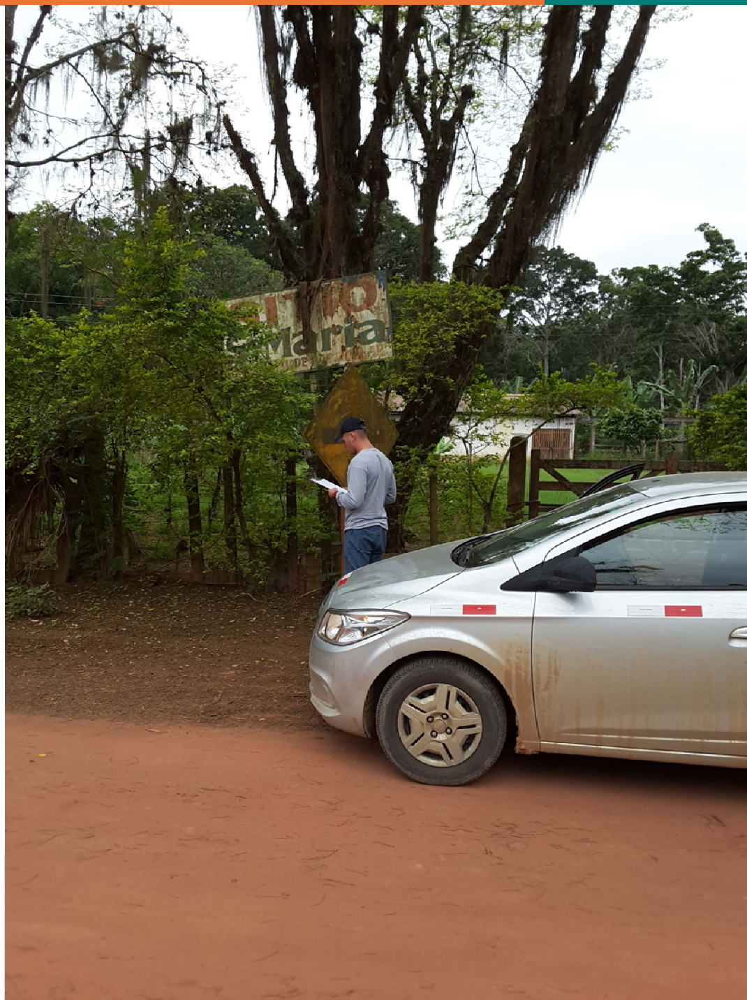
Figura 1-. Registro fotográfico de um funcionário da Synergia na rua Tenente Coronel Paixão, informada pelo manifestante.