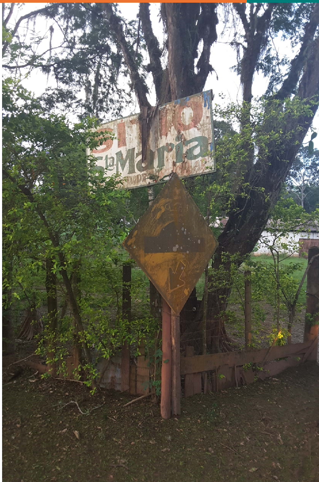
Figura 2- Sítio Santa Maria